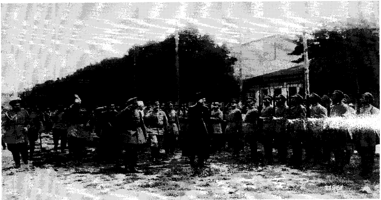
Гетьман Скоропадський зі штабом оглядає Сірожупанну дивізію. Серпень 1918 року

Особливі надії гетьман покладав на козацтво, в жовтні затвердив закон “Про відновлення українського козацтва”.